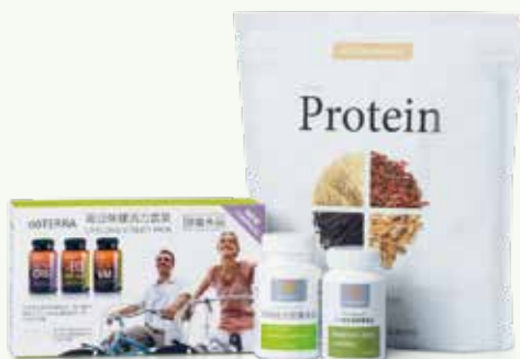
活力滿分LRP套裝 (香草)

LLV搭配輕暢複合膠囊、PB Assist+益生菌膠囊、多特瑞乳清蛋白粉，除了全面的營養照顧、更補充8種體內重要的消化酵素、60億益生菌與益菌生果寡醣及優質蛋白質，協助身體機能正常運作，提高代謝與有助肌肉生長，是您活力與能量的泉源。