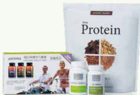
活力滿分LRP套裝 (巧克力)

60223973 建議售價 NT $7,735 會員價 NT $5,800 PV : 88