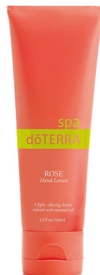
Healing Hands 玫瑰護手乳

一抹咕溜 --- 啊！好放鬆、好柔嫩、好喜歡！ 玫瑰的滋潤、玫瑰的呵護， 今天起，為了你的美麗，將玫瑰進行到底！