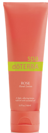
Healing Hands 玫瑰護手乳

一抹咕溜 --- 啊！好放鬆、好柔嫩、好喜歡！ 玫瑰的滋潤、玫瑰的呵護， 今天起，為了你的美麗，將玫瑰進行到底！