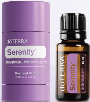
幸福恬靜複方精油