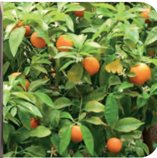
樂釋複方精油 見第 32 頁