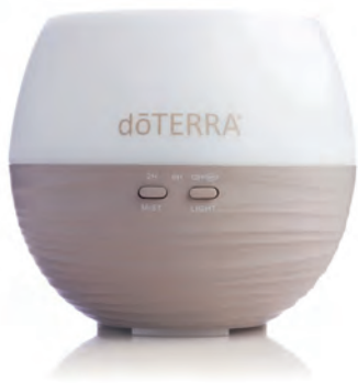
花瓣芳香噴霧器V2 Petal Diffuser