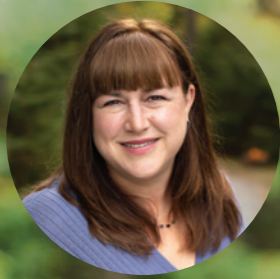
珍妮絲·費雪 (美國獸醫師)