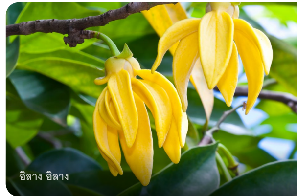
อีลาง อีลาง