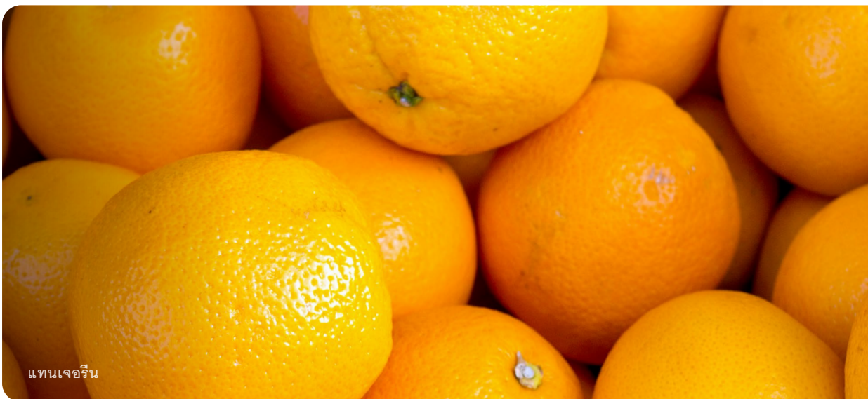
แทนเจอริน