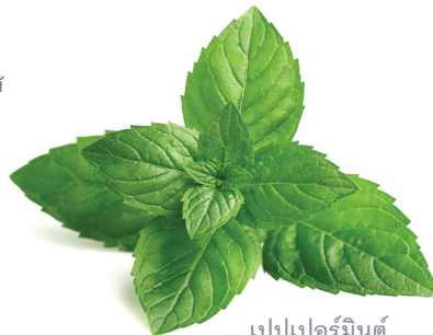
เปปเปอร์มินต์