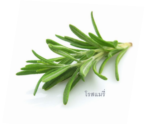
โรสแมรี่