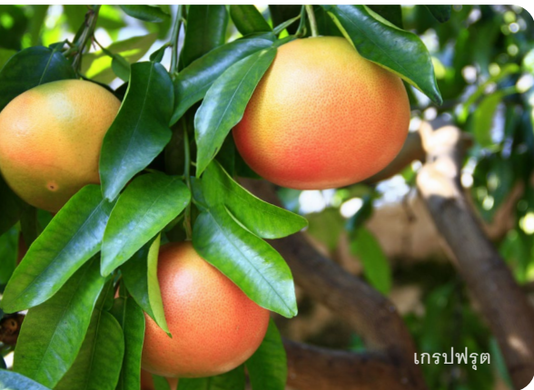
เกรปฟรุ้ต