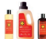
Линия On Guard