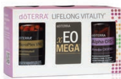
Комплекс dōTERRA Lifelong Vitality

Заряжайтесь энергией, поддерживайте и укрепляйте организм