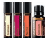
Цветочные масла для ухода за кожей