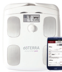
인바디사 가정용 BMI 측정기 약 25만원 상당