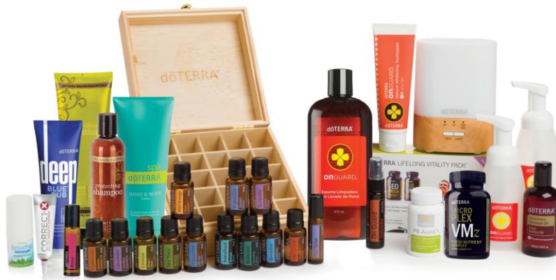
Imágen con fines ilustrativos