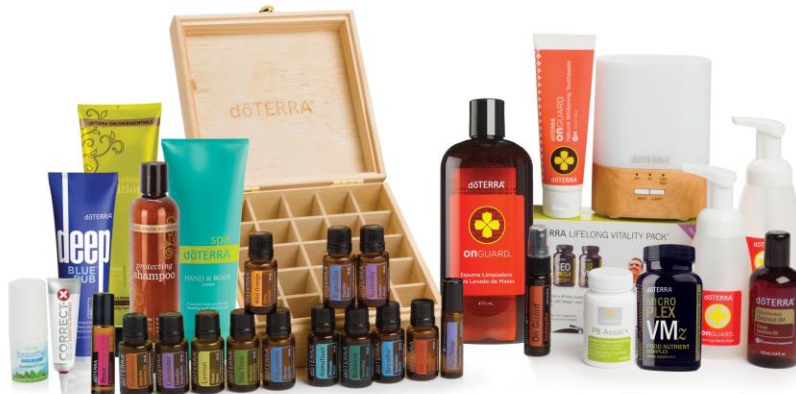
Imágen con fines ilustrativos