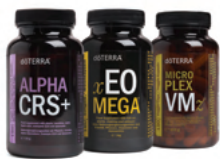
Lifelong Vitality Pack™