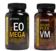
Daily Nutrient Pack™

Et choisissez 3 articles maximum parmi ceux proposés ci-dessous à prix réduit