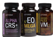
Lifelong Vitality Vegan Pack™