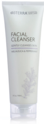
GESICHTSREINIGER 18 ml

dōTERRA Gesichtereiniger enthält die ätherischen CPTG™-Öle von Melaleuca (Teebaum) und Peppermint (Pfefferminze), die für ihre Fähigkeit bekannt sind, die Haut zu reinigen und zu straffen und einen gesunden Teint zu unterstützen. Die natürlichen Reiniger aus Extrakten von Yuccawurzel und Seifenrindenbaum befreien sanft von Unreinheiten und lassen die Haut sauber, frisch und glatt aussehen.