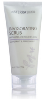
BELEBENDES PEELING 70 g

dōTERRA Gesichtereiniger enthält die ätherischen CPTG™-Öle von Melaleuca (Teebaum) und Peppermint (Pfefferminze), die für ihre Fähigkeit bekannt sind, die Haut zu reinigen und zu straffen und einen gesunden Teint zu unterstützen. Die natürlichen Reiniger aus Extrakten von Yuccawurzel und Seifenrindenbaum befreien sanft von Unreinheiten und lassen die Haut sauber, frisch und glatt aussehen.