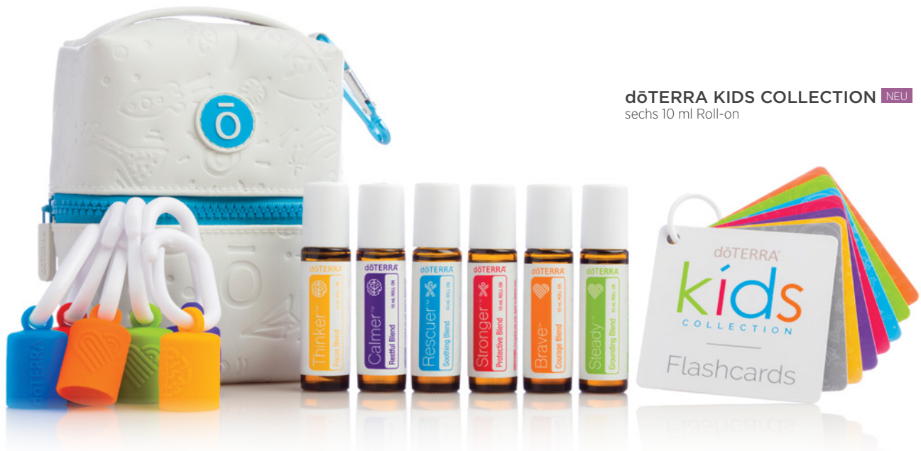
dōTERRA KIDS COLLECTION NEU sechs 10 ml Roll-on

Ganz gleich ob erfahrener Anwender oder Anfänger mit ätherischen Ölen – die dōTERRA Kids Collection ist eine komplette und fertige „Ganzkörper“-Toolbox für ätherische Öle, die entwickelt wurde, um die Gesundheit und das Wohlbefinden unserer Kleinen auf sichere Weise zu schützen. Diese ätherischen Ölmischungen wurden gezielt für die Entwicklung von Geist, Körper und Emotionen entwickelt und zeichnen sich durch einzigartige Kombinationen aus, die kraftvolle Vorteile bieten und gleichzeitig sanft zu empfindlicher Haut sind.