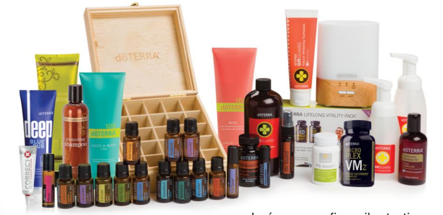
Imágen con fines ilustrativos