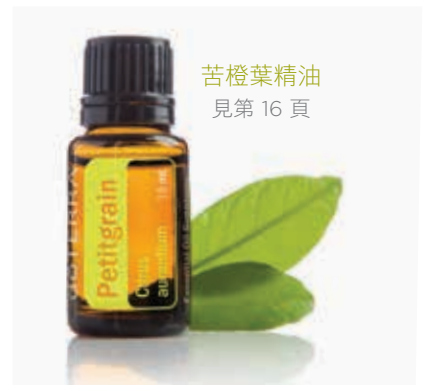
苦橙葉精油 見第 16 頁