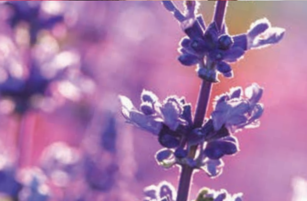
芳香調理心情套裝呵護系列 見第 26 頁