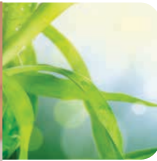
天然防護30毫升噴瓶 見第 35 頁