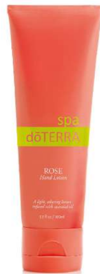
Healing Hands 玫瑰護手乳

一抹咕溜 --- 啊！好放鬆、好柔嫩、好喜歡！ 玫瑰的滋潤、玫瑰的呵護， 今天起，為了你的美麗，將玫瑰進行到底！