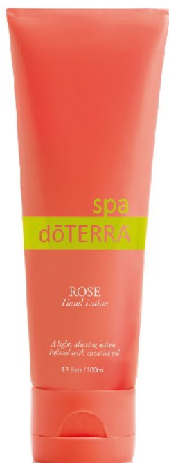
Healing Hands 玫瑰護手乳