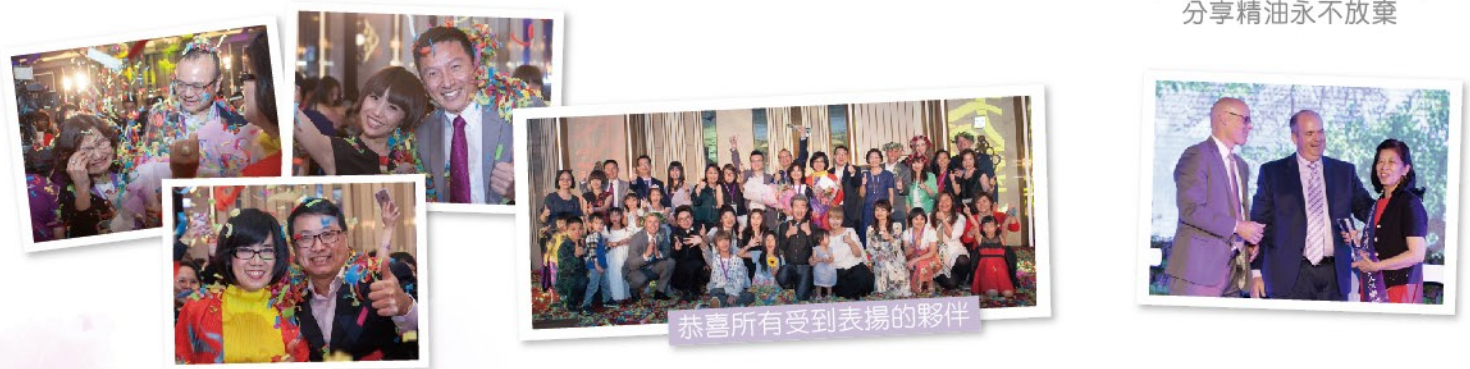
恭喜所有受到表揚的夥伴