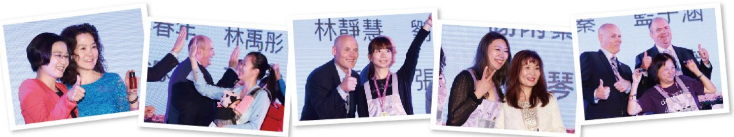
· 歡樂的表揚晚宴 ·