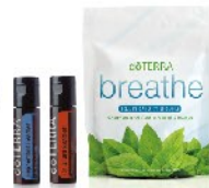
薄荷晶球+保衛複方晶球 +順暢清涼喉糖 (價值 2,180元)