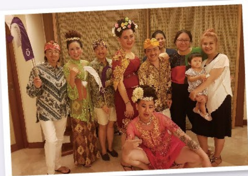
▲在臺灣市場報告會議中，我們興奮地表揚本次獎旅的贏家