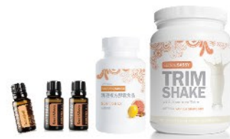
〈完美體雕LRP套裝-香草〉