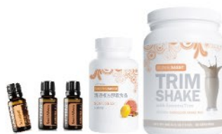
〈完美體雕LRP套裝-巧克力〉