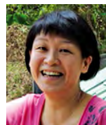
蘇玉收 有許多失敗的 人，並不知道他 們放棄的時候， 距離成功有多 近。