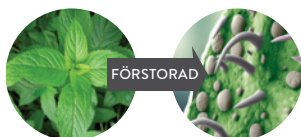
Oljesäck på blad av pepparmynta