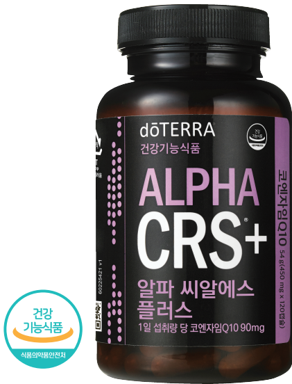
코엔자임큐텐 건강기능식품 450mg x 120캡슐