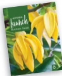
Launch 가이드 북