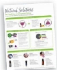
Natural Solutions Class Handout 강의자료