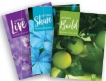
Live, Share, Build 가이드 북