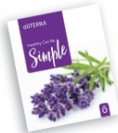
Healthy Can Be Simple 가이드북