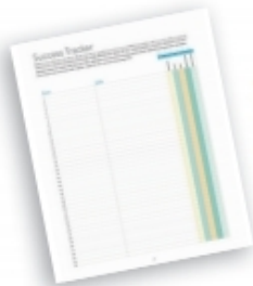
Success Tracker 성공 기록지