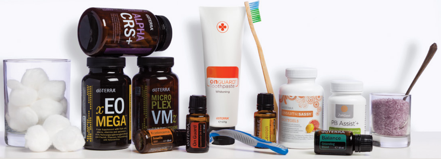
A gyártás időpontjában minden információ megfelel a valóságnak.