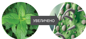
Маслена жлеза на листо от мента